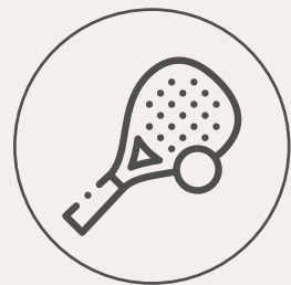
2 canchas de pádel