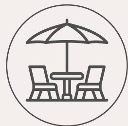
Pabellón con terrazas