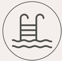
Alberca y baños