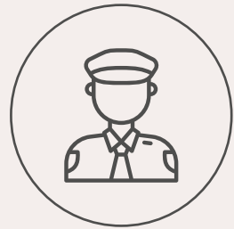
Caseta de acceso