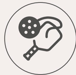
Cancha de pickleball